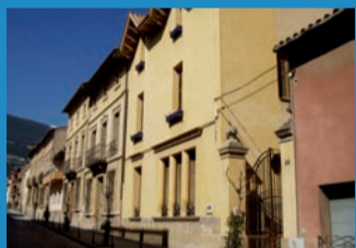
CARRER DEL MARQUÈS DE PEÑAPLATA

Continu urbà obert a finals del segle XIX per connectar la vila vella de Centelles i la nova estació de ferrocarril. El tram de baix està dedicat al general Ramon Blanco Arenas, el qual va fer favors als centellencs que feien el servei militar. El tram de dalt va rebre el nom del poeta i polític català que fou fundador dels Cors de Clavé. Destaquen els edificis de Can Pujol, Can Pratmarsó (noucentista, c. 1920), Can Pratmarsó-Aranyó (eclèctic, 1899-1901), Can Verdaguer (modernista, 1900-1910) i la Societat Coral "La Violeta".