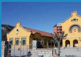
ESCOLA ILDEFONS CERDÀ

Conjunt arquitectònic noucentista construït entre 1930 i 1932, segons un projecte de 1918. El conjunt és molt coherent arquitectònicament i reflecteix una època de gran potència cultural. De fet, és un exemple interessant del model d'escoles mixtes implantat per la Generalitat republicana arreu de Catalunya. Fou inaugurat pel President Francesc Macià el 1932.