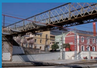
ESTACIÓ DE FERROCARRIL

El traçat de la línia de Barcelona a Puigcerdà, dissenyat definitivament per Ildefons Cerdà, fill il·lustre de Centelles, fou inaugurat el 8 de juliol de 1875. El tren va ser utilitzat per tota mena de passatgers, entre els quals destacaven els burgesos barcelonins que havien escollit la vila de Centelles per estiu. En el conjunt destaca la passarel·la per a vianants construïda l'any 1909 per facilitar el pas a les fàbriques Estabanell i Batlle.