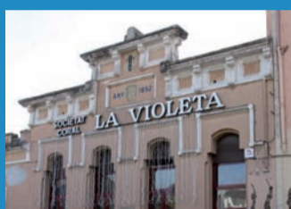
SOCIETAT CORAL "LA VIOLETA"

Edifici modernista primerenc amb altres elements eclèctics construït pels volts de 1899 per fer de seu de la Societat Coral "La Violeta". La Societat, vinculada als Cors de Clavé, va ser fundada el 1892, com ho indica la data pintada a la façana principal d'un edifici que dona testimoni de la primera societat d'esbarjo de la Centelles industrial. Arquitectònicament són rellevants tots els elements que persisteixen de la construcció original.