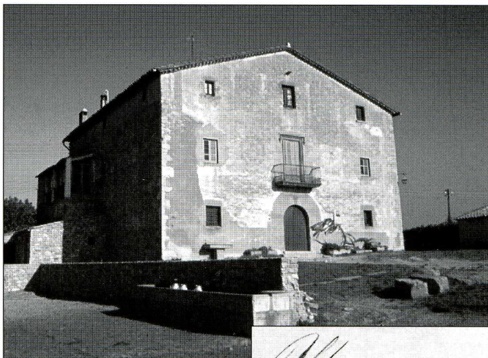
Masia actual del Cerdà amb la signatura de l'urbanista

Però dos fets de caràcter familiar (1848) fan que aquesta incipient carrera d'enginyer de l'Administració sigui abandonada el 25.07.1849, quan es dona de baixa del cos. D'una