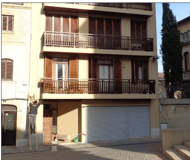
Edificis de la plaça Mossèn Xandri, 4

La inversió total realitzada ronda els 100.000 euros.