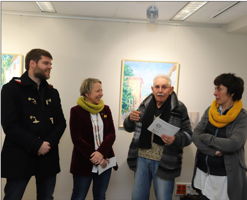
Un moment de la inauguració del Niu del Palau