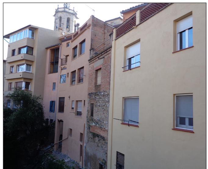
Façanes del darrera dels edificis del carrer Santa Anna