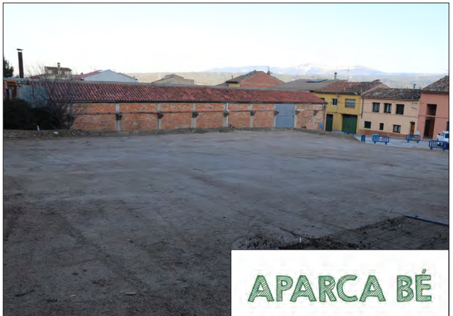
Nou aparcament al Carrer de Sant Martí

Els vigilants municipals sancionen les infraccions per captació d'imatge però per a fer un entorn més segur per a tothom cal la col·laboració de tots i evitar els aparcament a les voreres o zones no permeses.