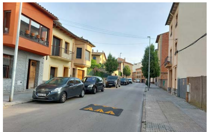
Coixins berlinesos recentment col·locats al C/ del Pla del Mestre, C/ de Girona i Av. de Rodolf Batlle.