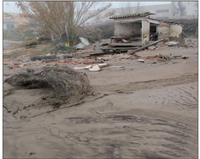
Dues imatges de la zona de Sant Antoni