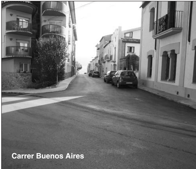
Carrer Buenos Aires