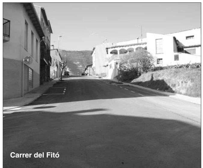
Carrer del Fitó