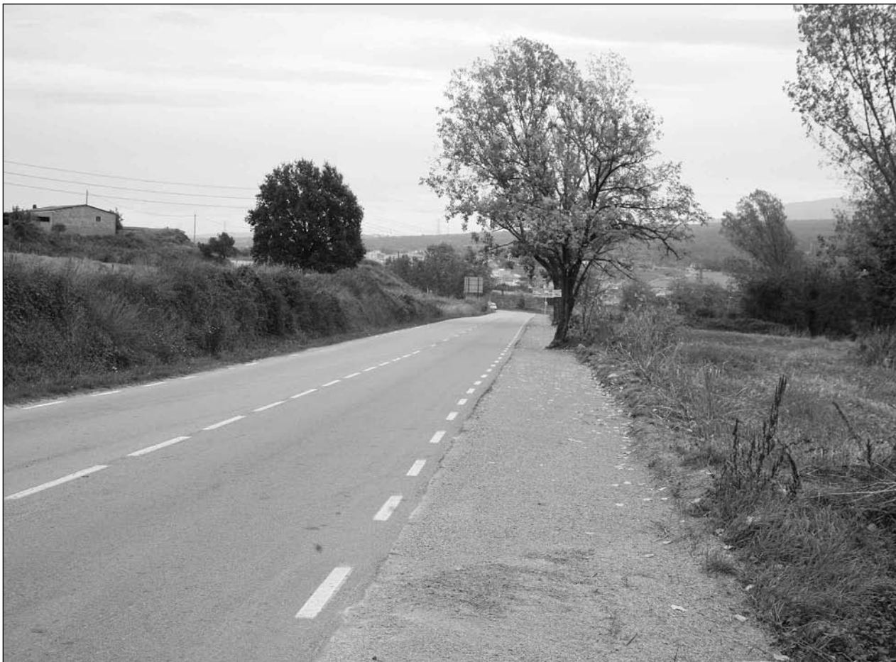
Vorera de la carretera comarcal 1.413