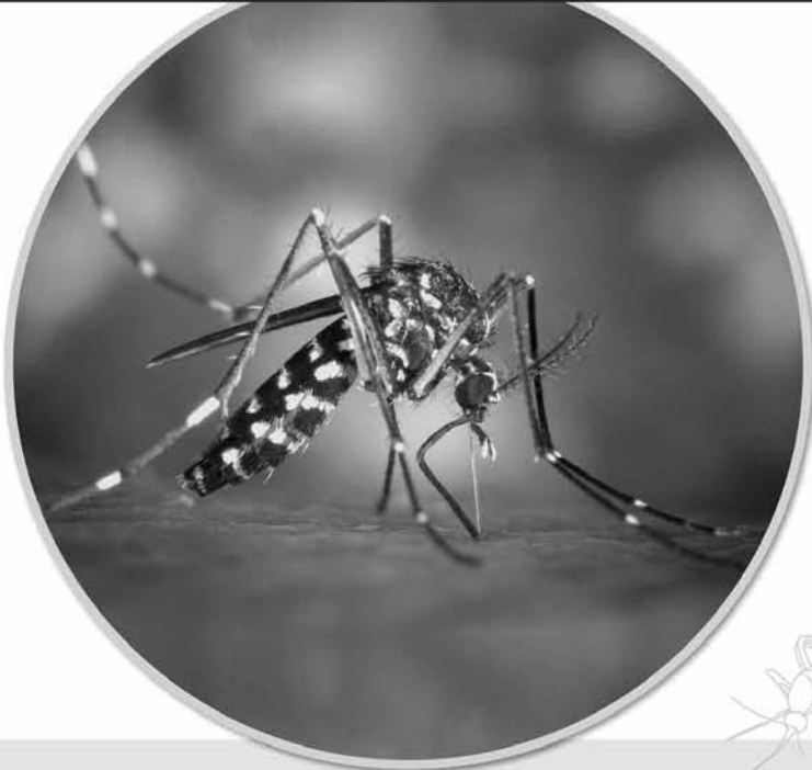
Mida real: de 2 a 10 mm