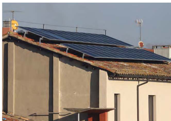
Plaques solars a l'edifici de la Casa de Cultura

• S'han instal·lat plaques solars fotovoltaïques per autoconsum a l'edifici de l'escola d'Adults. S'han emplaçat 8KW de potència. La instal·lació permet que durant