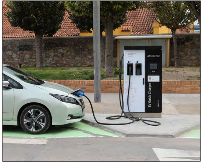
Recàrrega per a vehicles elèctrics a la carretera de St. Feliu