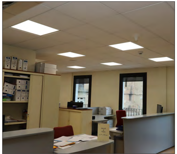
Nova il·luminació a les dependències municipals