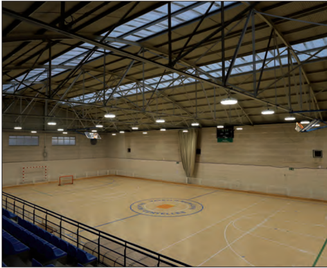
Noves lluminàries al Pavelló gran