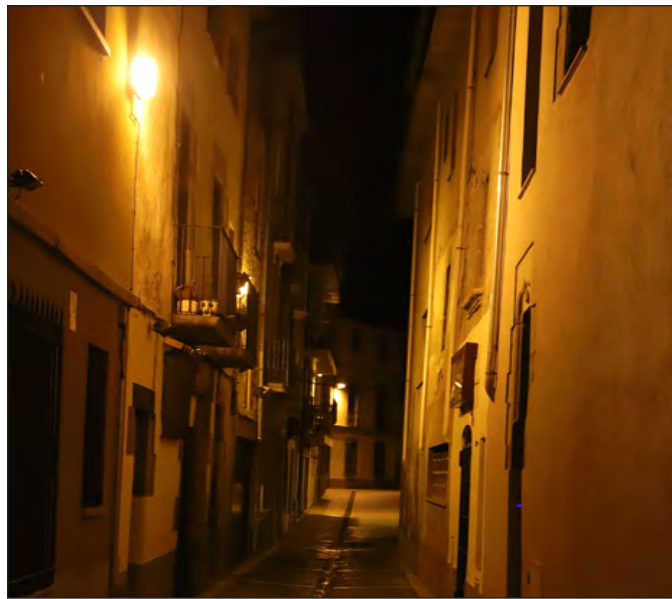
Lluminàries noves als carrers del Pla de Barris