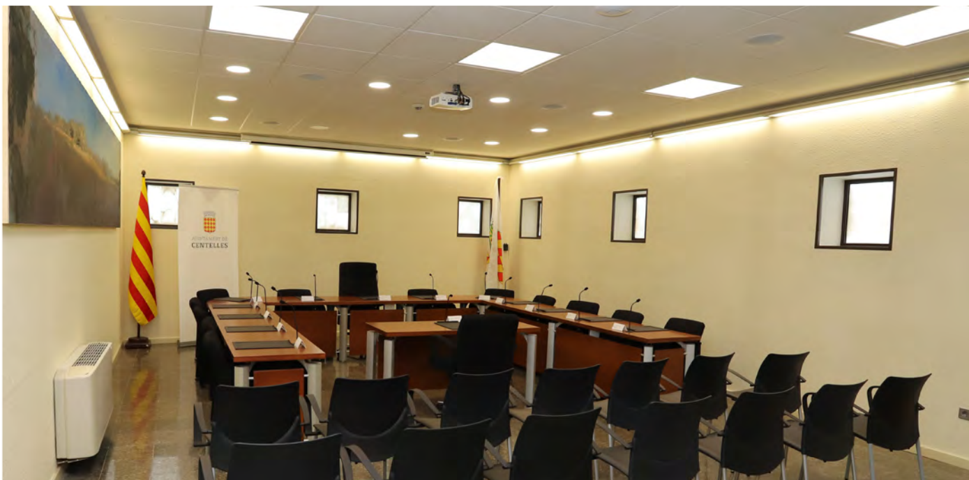
Sala de plens de l'Ajuntament de Centelles