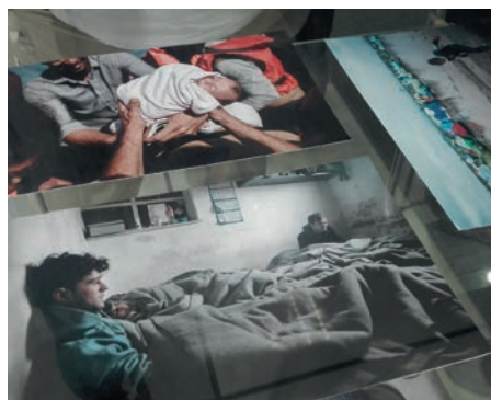
Exposició de Marc Sanyé.