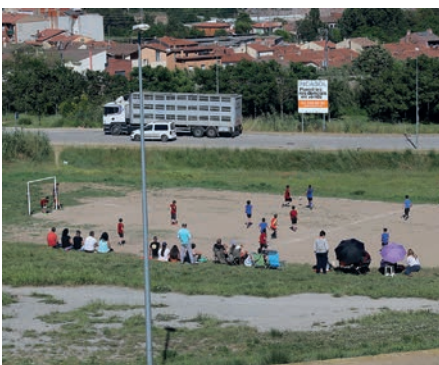
Partit de futbol barri.