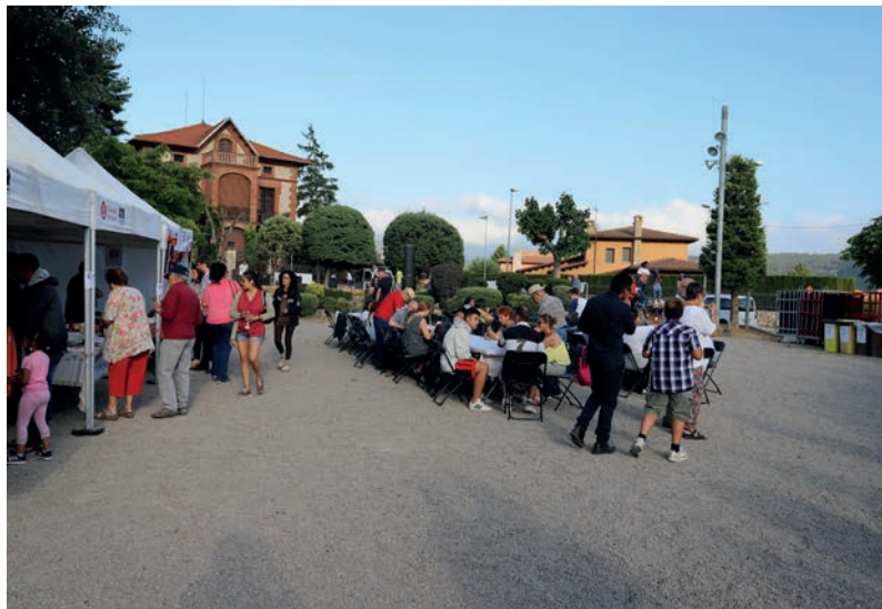
Festa de la Solidaritat.