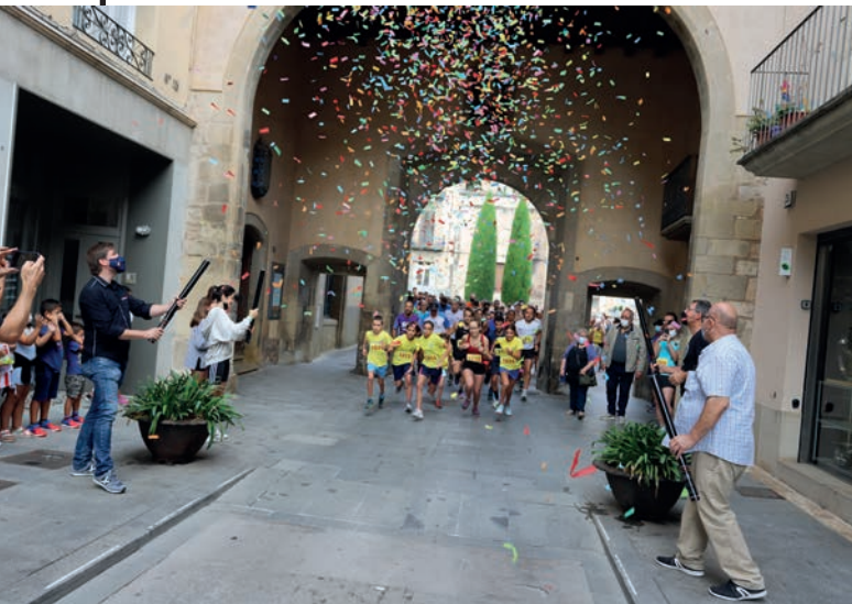
10a cursa urbana en solidaritat amb el poble sahrauí.

Aquest mes de novembre es portarà a terme CentSolidàries, la setmana de la Cooperació i la Solidaritat, del 20 al 28 de novembre, coincidint amb la 6a edició dels Dies Europeus de la Solidaritat Local. Els actes organitzats van des de xerrades, contes a la biblioteca, un espectacle per a tots els públics i la Nit de la Solidaritat entre altres activitats.