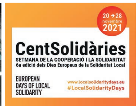
Setmana de la cooperació i la solidaritat.