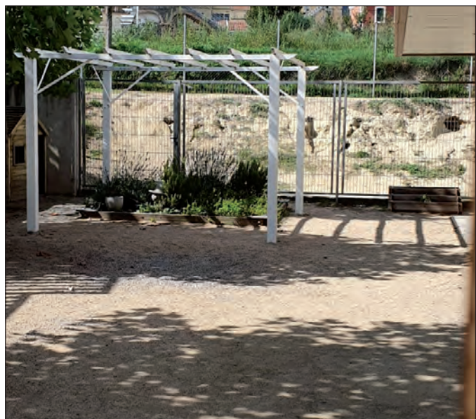
Millora dels espais exteriors a l'Escola Xoriguer

Amb l'objectiu de mantenir el bon estat dels equipaments educatius municipals, al llarg d'aquests primers mesos de curs escolar s'han dut a terme una sèrie de millores i accions a les diferents escoles, des d'Educació Infantil fins a Primària.