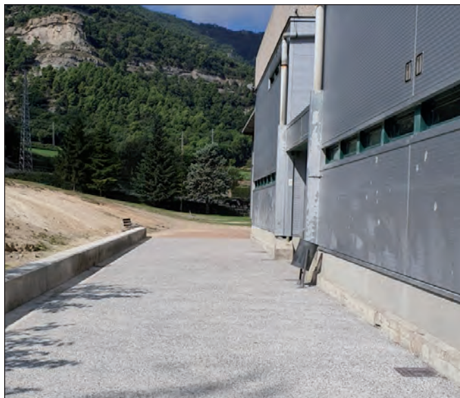
Arranjament de la tanca perimetral i millora dels espais exteriors a l'Escola Ildefons Cerdà