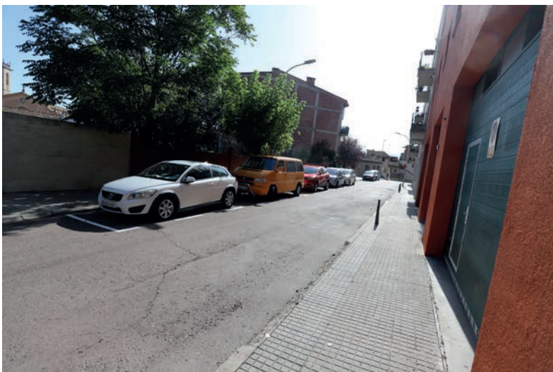
Carrer Riumundé, on s'ha senyalitzat les zones d'aparcament