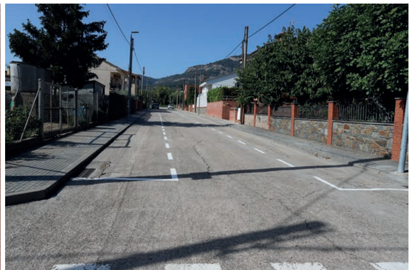
Carrer Pompeu Fabra, on també s'ha pintat les zones d'aparcament a banda i banda