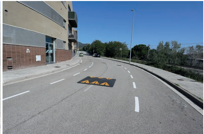
Al carrer de Can Minguet s'ha pintat les zones d'aparcament als dos costats i s'han instal·lat reductors de velocitat