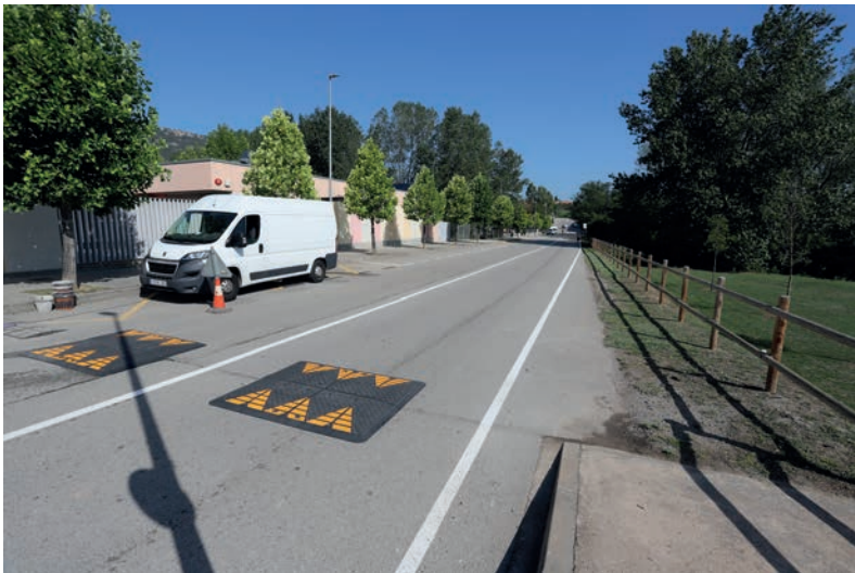
Al carrer Hostalets s'han instal·lat reductors de velocitat davant l'escola Xoriguer i s'ha pintat i senyalitzat els vials i els aparcaments

A l'entorn del camp de futbol, s'ha senyalitzat horitzontalment, els aparcaments al carrer de Pompeu Fabra, mesura que es complementarà amb una rotonda remuntable a la Ronda dels Esports amb el carrer de Josep Falgueras i Pujol que ha de servir per a millorar la seguretat en aquesta cruïlla. Al carrer Riumundé també s'han pintat les zones d'aparcament.