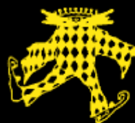
Comissió de Carnestoltes