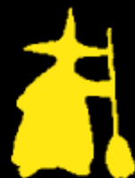
Cau de Bruixes de Centelles