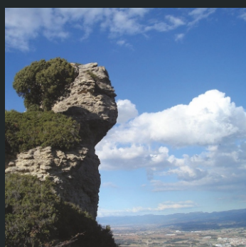
EL MORRO DE PORC