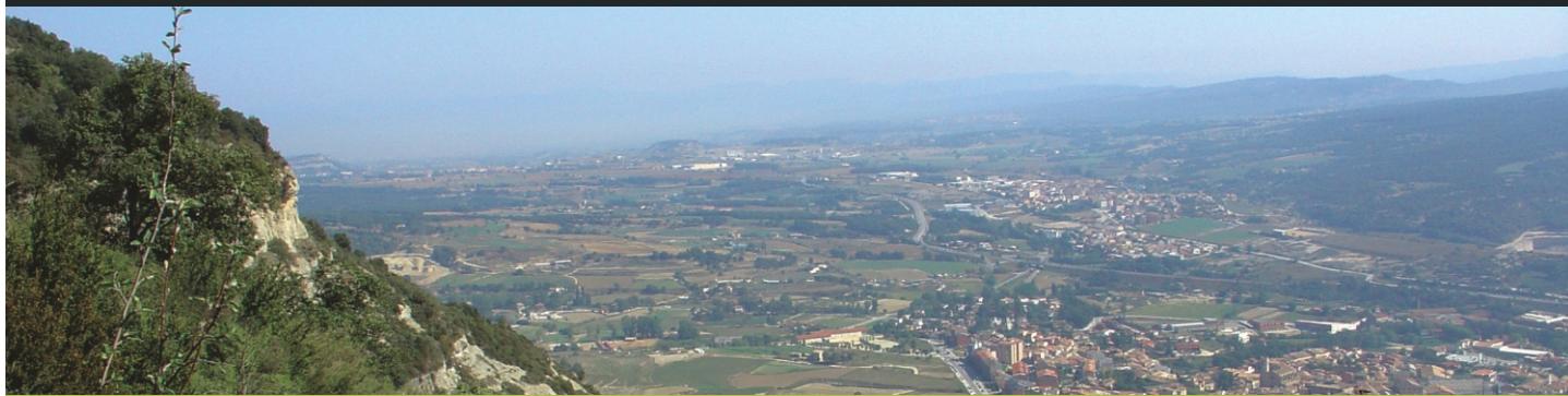
vista de Centelles i Osona sud des de la Costa

Dominada per l'alterós Puigsagordi i la cinglera de les Baumes Corcades, la Costa és el grandios escenari que emmarca la vila de Centelles per la banda de ponent. En aquest sector muntanyenc es troben nombroses masies, algunes d'elles continuadores dels primerencs assentaments medievals dels segles IX i X. Aquest itinerari ressegueix el rerepaís pagès de Centelles i és el complement perfecte de la visita al nucli urbà, on es troben els testimonis gòtics de l'antiga vila comtal i les construccions modernistes d'una de les principals destinacions d'estiueig osonenques.